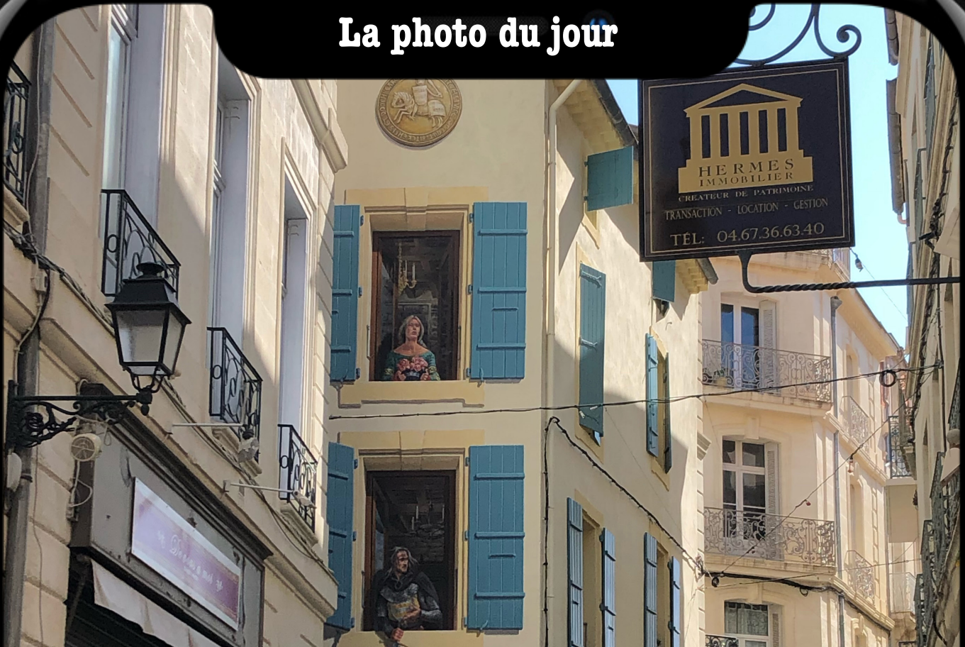
«Une nouvelle fresque rue de la Citadelle»