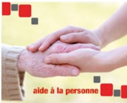
aide à la personne