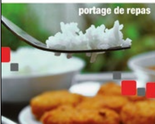
portage de repas