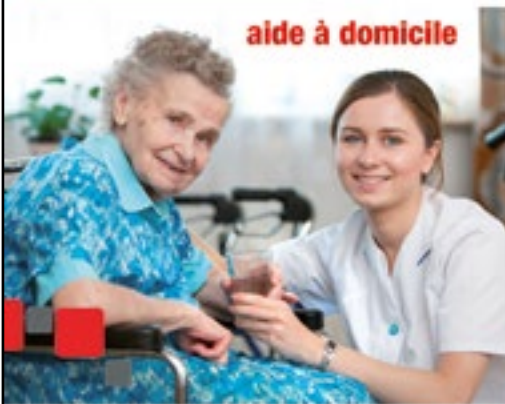
aide à domicile